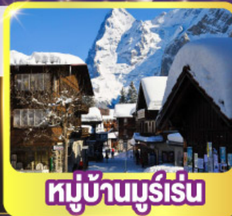
หมู่บ้านมูร์เร็น