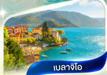
เบลลาจีโอ