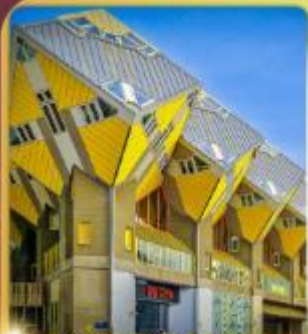
บ้านลูกเต๋า โคกคูนูส

“ล่องเรือหลังคากระจก” ชมกรุงอัมสเตอร์ดัม