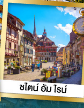
ชไตน์ อัม โรน