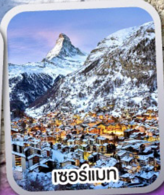
เซอร์แมท