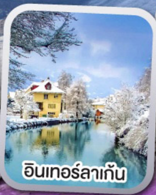
อินเทอร์ลาเก้น