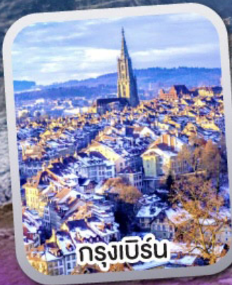
กรุงเบิร์น