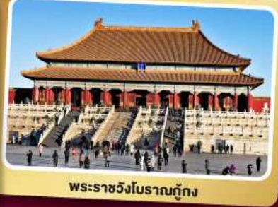
พระราชวังโบราณกู้กง