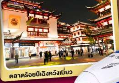
ตลาดร้อยปีเจิ้งหวิงเมี่ยว