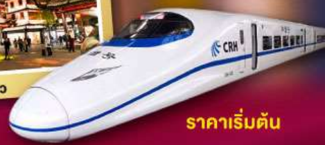
ราคาเริ่มต้น