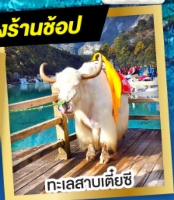
ทะเลสาบเตี้ยซี