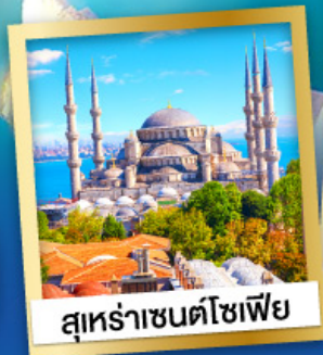
สุหระาเซนตโซเฟีย