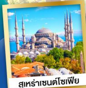
สุหระชาซนตโซเฟีย