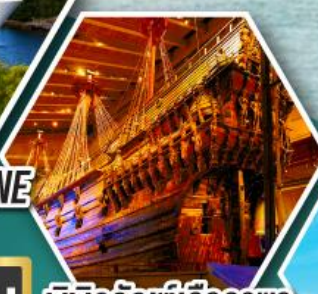
น้ำพุแห่ง ราชินีเก็ฟออน