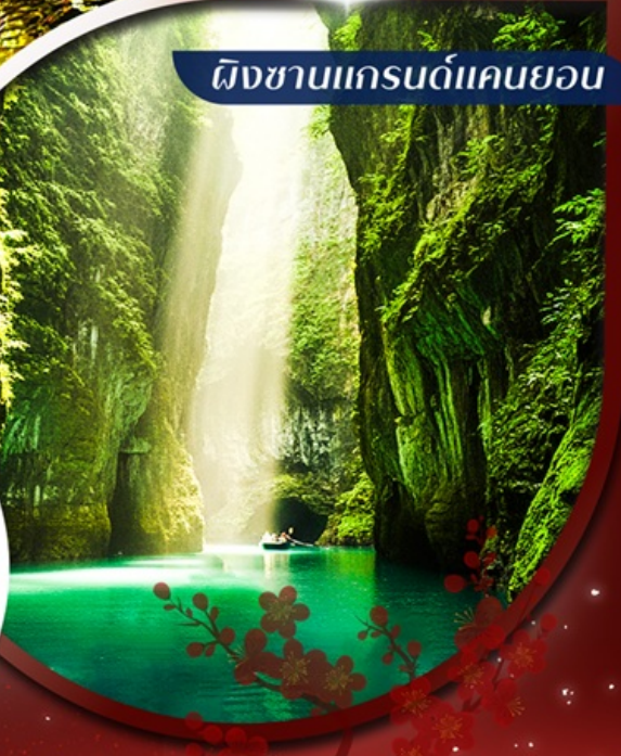
ผิงชานแกรนด์แคนยอน