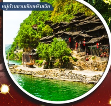
หมู่บ้านซานเซี่ยเหรินเจีย