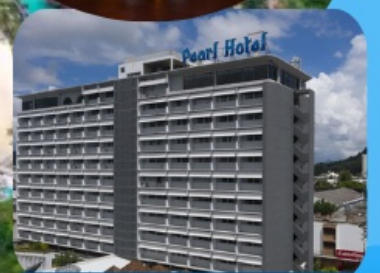
โรงแรมเพิร์ล