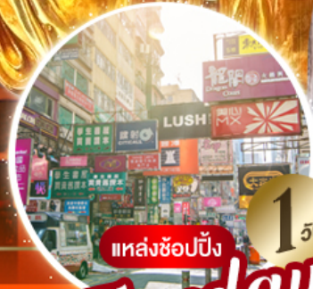
แหล่งช้อปปิ้ง