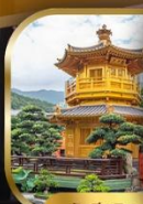
วัดชี่หลิน