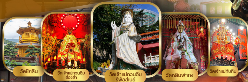
วัดซีหลิน