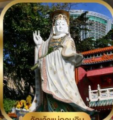
วัดเจ้าแม่กวนอิม สวีตเดีย