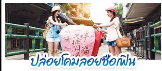
ปลอ้อคอมลอยซือเฟิน