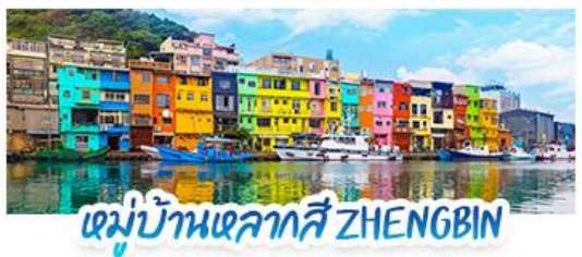
หมู่บ้านหลากสี ZHENGBIN

18 - 21 ก.ค. 69 | 12 - 15 ก.ย. 69 15 - 18 ส.ค. 69 | 28 - 31 ต.ค. 69