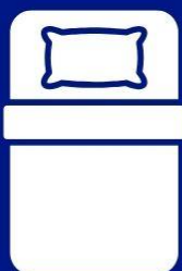
ห้องพักเดี่ยว SINGLE BED ROOM (SGL)

ห้องพักสำหรับ 1 ท่าน มีค่าใช้จ่ายเพิ่มจากค่าทัวร์