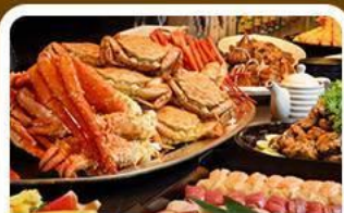
บุฟเฟ่ต์ชาบู+ชาบู 3 ชนิด