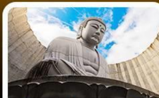
เป็นเขาแห่งพระพุทธรเจ้า