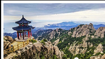
ภูเขาเลาซาน