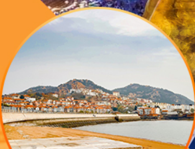
ซาจื่อโป่ว