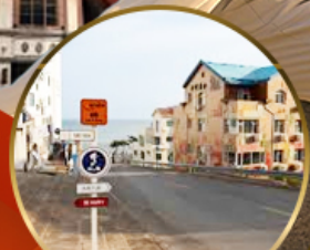
ถนนฮั่วจวีป่า