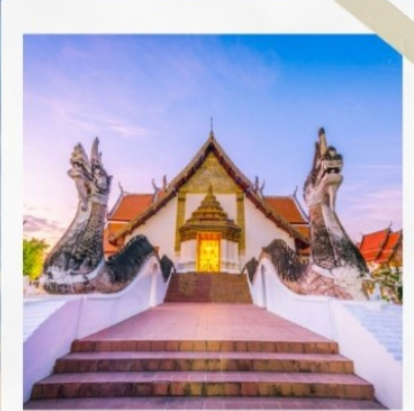
วัดกุสินทร์