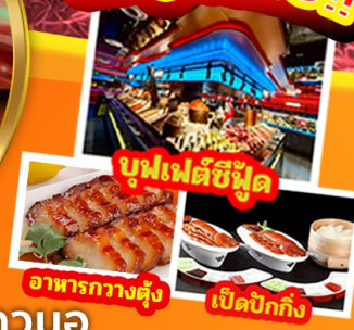
บุฟเฟ่ต์ซีฟู้ด