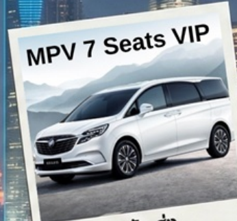
MPV 7 Seats VIP