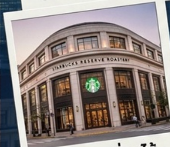
สตาร์บัคเชียงใหม่