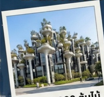
อาคาร 1000 ต้นไม้