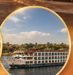
ล่องเรือแม่น้ำไนล์