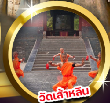
วัดเล่าหลิน