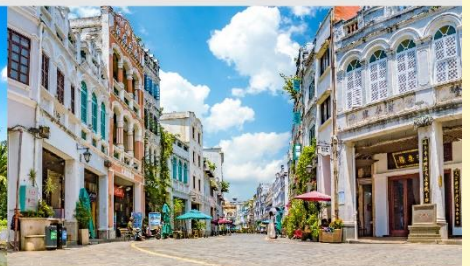
ถนนโบราณฉีไหลว

*ทางบริษัทฯ ขอสงวนสิทธิ์ในการสลับโปรแกรมทัวร์ตามความเหมาะสมขึ้นอยู่กับสถานการณ์หน้างาน โดยคำนึงถึงผลประโยชน์ของลูกค้าเป็นสำคัญ