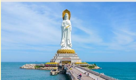
เจ้าแม่กวนอิมหนานชาน