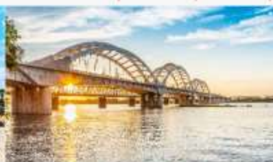
สะพานรถไฟ