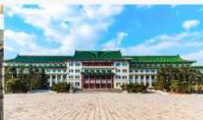
จัตุรัสวัฒนธรรม