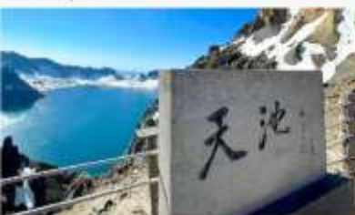
อุทยานฉางโปซาน