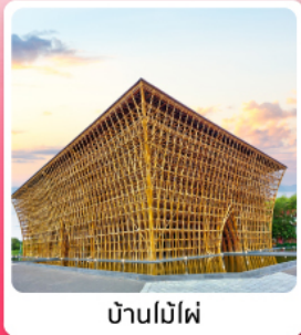
บ้านบันไผ่