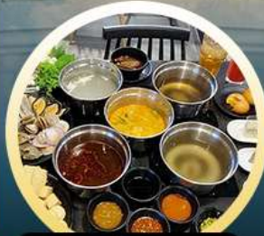
ซาบู้ฮ่องกง

02-04 มี.ย. 18-20 มี.ย. 07-09 มี.ย. 20-22 มี.ย. 13-15 มี.ย. 25-27 มี.ย. 14-16 มี.ย. 28-30 มี.ย.