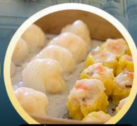
ต้มน้ำฮ่องกง