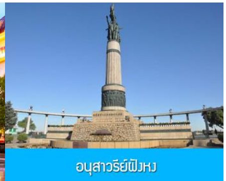
อนุสาวรีย์ผึ้ง