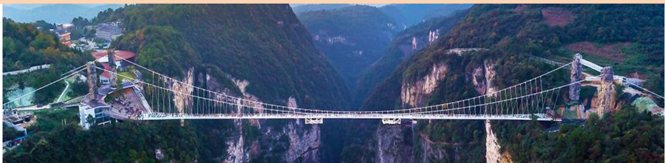
สะพานกระจกข้ามหุบเขาแกรนด์แคนยอน

หมายเหตุ การเลือกซื้อออฟชั่น ทางบริษัทขอสงวนสิทธิ์หากจำนวนผู้ซื้อไม่ถึง 15 ท่าน, ออฟชั่นนั้นไม่สามารถจัดให้ลูกค้าไปเที่ยวได้ จึงเรียนมาเพื่อให้นักลูกค้าได้เข้าใจถูกต้องตรงกัน