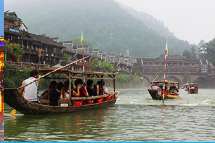
ล่องเรือแม่น้ำถั่วเจียว

วันที่สาม เมืองจางเจียเจี๋ย-ออฟชั่นไกด์ขายสะพานกระจกข้ามเขาแกรนด์คอนยอน - เมืองโบราณฟงหวง-ล่องแม่น้ำถั่วเจียว-นอนในเมืองเก่าฟงหวง