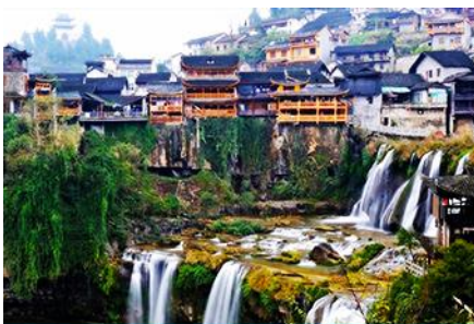
เมืองโบราณฟงหวง

https://www.cielchine.com/zhangjiajie-hotels/zui-xiang-xi-hotel/