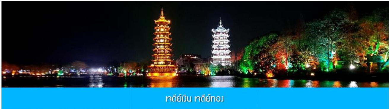
เจดีย์ยี่น เจดีย์ยง