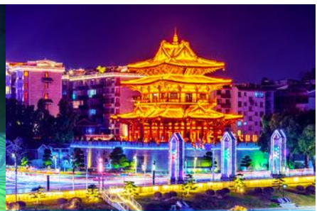
หอเขี้ยวเหย้าโหลว