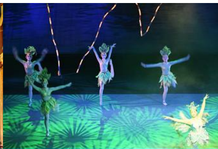
โชว์ DREAM LIKE LIJIANG