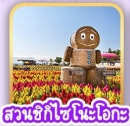
สวนซิกิโซโนะโอะกะ