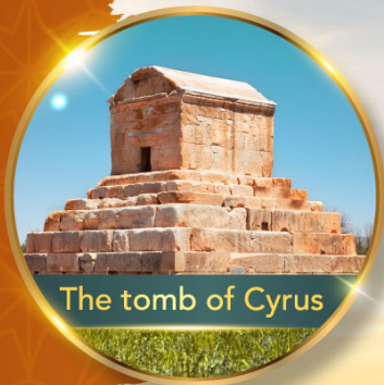
The tomb of Cyrus