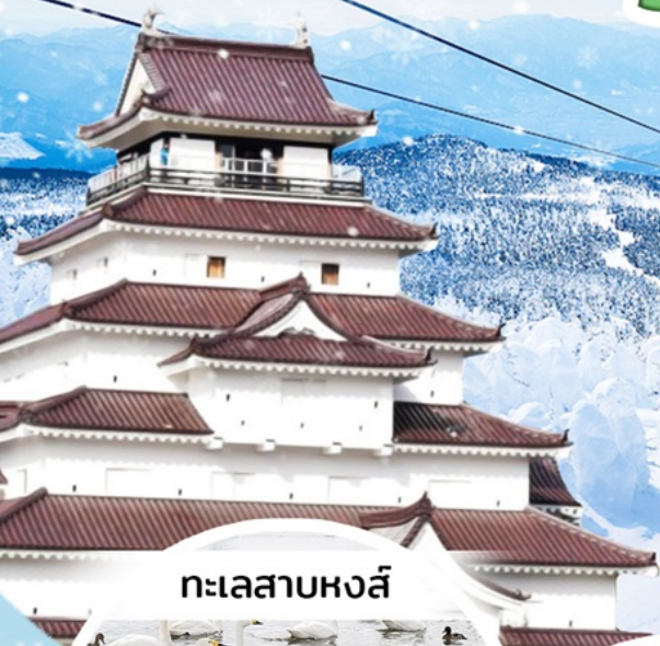
ทะเลสาบหงส์