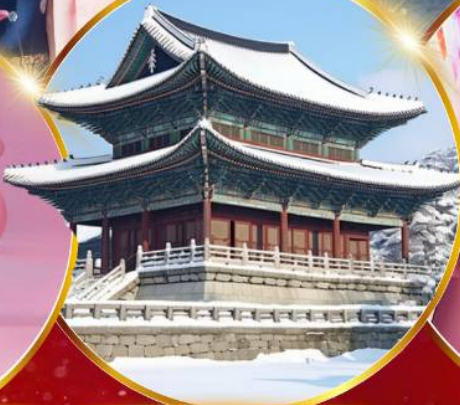
พระราชวังเคียงบกกรุง