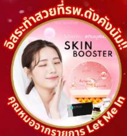
อิสระทำสวยที่พ.ดังคังนัม!! SKIN BOOSTER คุณนงนารายการ Let Me In

ชมจอ LED ขนาดยักษ์ที่รีสอร์ท 5 ดาว ใหญ่ที่สุดในเอเชียเหนือ ชมพระราชวังคยองบกกรุง ย่านฮงแดหมู่บ้านบุคซอน ฮงอก ใส่ชุดฮันบก ทำข้าวห่อสาหร่าย อิสระช้อปปิ้ง Lotte Duty Free