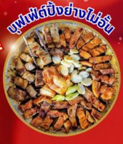
บุฟเฟ่ต์ปิ้งย่างไม่วัน