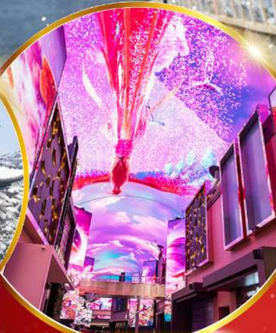
INSPIRE Entertainment Resort

ชมจอ LED ขนาดยักษ์ที่รีสอร์ท 5 ดาว ใหญ่ที่สุดในเอเชียเหนือ ชมพระราชวังคยองบกกรุง ย่านฮงแดหมู่บ้านบุคซอน ฮงอก ใส่ชุดฮันบก ทำข้าวห่อสาหร่าย อิสระช้อปปิ้ง Lotte Duty Free