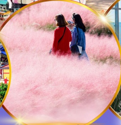
สวนสาธารณะแดโจ