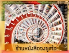
ร้านหนึ่งสี่องซูเก๋