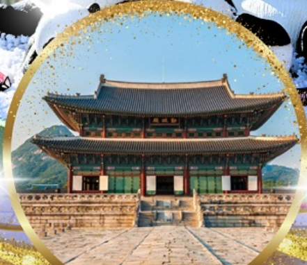
พระราชวังเคียงบกกุง