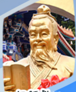
หลวงดำเซ็งน