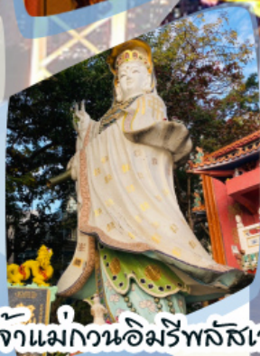
เจ้าแม่กวนอิมรัพลัสเบง