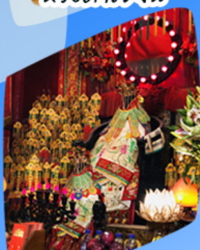
เจ้าแม่กวนอิมซี่มเงิน