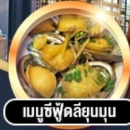
เมามูซีฟู้ดลึยมูนูน