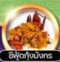
ซีฟู้ดกุงมิงhor