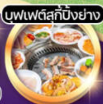
บุนเฟตสุกปึงย่าง