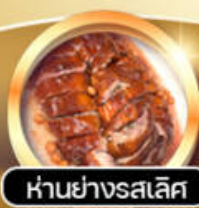
ห่านย่างรสเลิศ