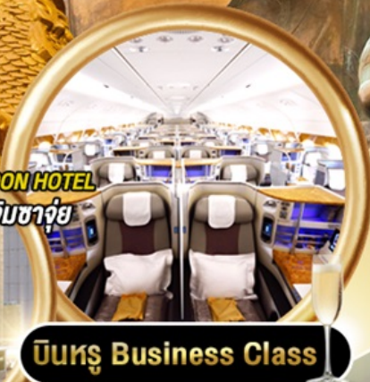
บินหรู Business Class