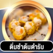
ติ่มซำต้นตำรับ

การ์ตูนดี!! พักหรู 4 ดาว THE KOWLOON HOTEL ติดถนนนาธาน ย่านช้อปปิ้งจิมซาจี้