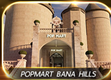
POP MART BANA HILLS

สัมผัสความงามหมู่บ้านฝรั่งเศสที่บานาฮิลล์ ซอปปิง POPMART