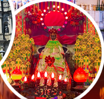
เจ้าแม่กวนอิมฮองฮำ