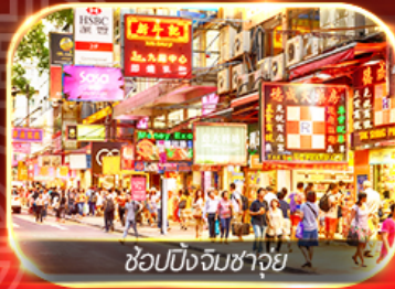
ช้อปปิ้งจิมซาจุ่ย