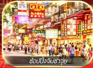
ช้อปบั้งจิมซาจุ้ย