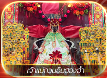
เจ้าแม่กวนอิมสองอำ