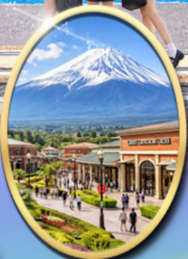
Gotemba Premium Outlets

รหัสทัวร์ RJ-XJ133 เส้นทาง 5D 3N กันยายน 2569