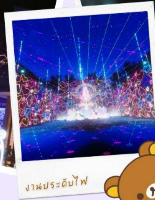
งานประดับไฟ