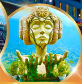
โมนาน่า คาเฟ่