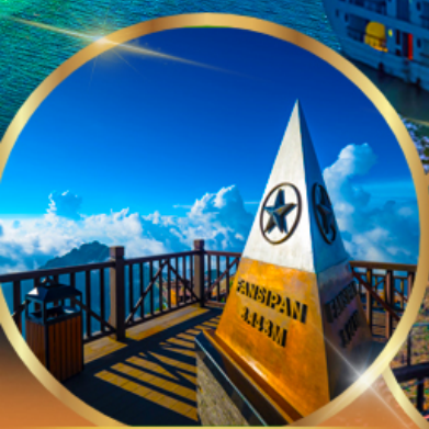
ยอดเขาฟานซีปัน

พักโรงแรม ★★★★★ GRAND SILK PATH SAPA HOTEL 2 คืน ROYAL CASINO HALONG HOTEL 1 คืน