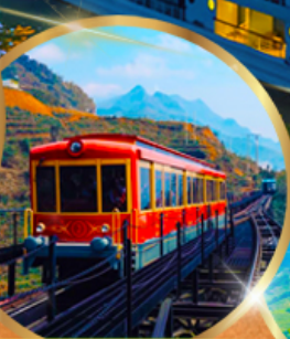
รถราง ซาปา