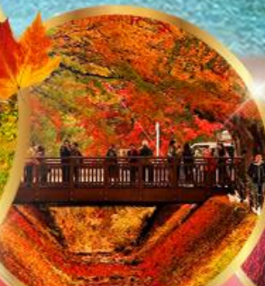
อุโมงค์เมเปิ้ล