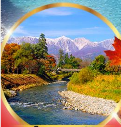
โออิเดะ พาร์ค