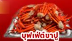
บุฟเฟ่ต์ซาชิมิ

พิกนากาโมะ 1 คืน พิกนากายามา 1 คืน พิกฟูจิ 1 คืน ออนเซ็น 2 คืน