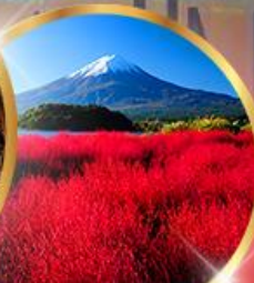
โออิชิ พาร์ค

ราคา เริ่มต้น 39,919 บาท รวมภาษีมูลค่าเพิ่ม 7%