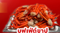
ซูฟเฟ็ตซายู

พักนทมาไม่ 1 คืน พักททคยาฆ่ามา 1 คืน พักฟูจิ 1 คืน ออนเซ็น 2 คืน