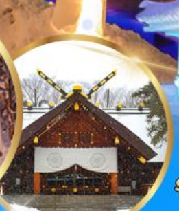
ศาลเจ้า ออกโทโต

เดินทาง 04 - 09 กุมภาพันธ์ 68 05 - 10 กุมภาพันธ์ 68