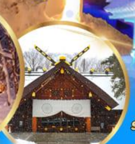
ศาลเจ้า ฮอกไกโด