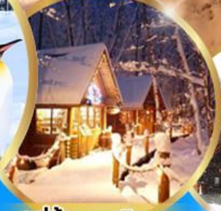
หมู่บ้านเทพนิยาย มิงเกิลเทอเรส