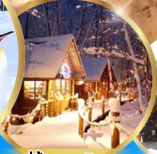
หมู่บ้านเทพนิยาย นิงเกิลทอเรส