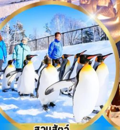
สวนสัตว์ อาซาฮิยาม่า