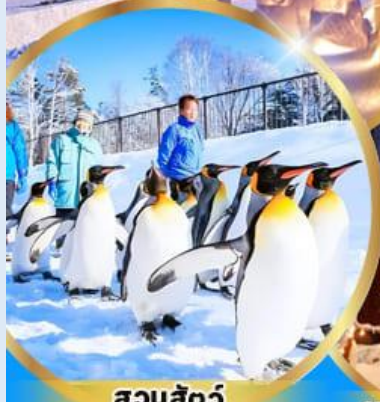
สวนสัตว์ อาซาฮิยาม่า